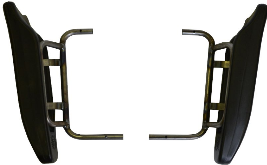
Photo vue de devant avec supports / Photo from the front with supports