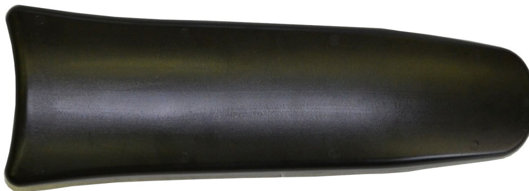
Photos vue de côté de carrosserie lateral / Photo of the side of the bodywork

Signature et tampon de l'ASN / Signature and stamp of the ASN