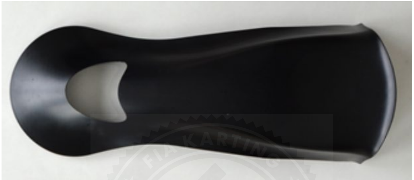
Photo vue de devant du panneau / Photo of the front of panel