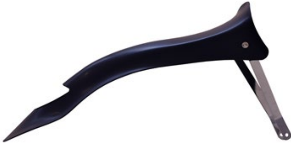
Photo vue arrière avec supports / Photo from the rear with supports